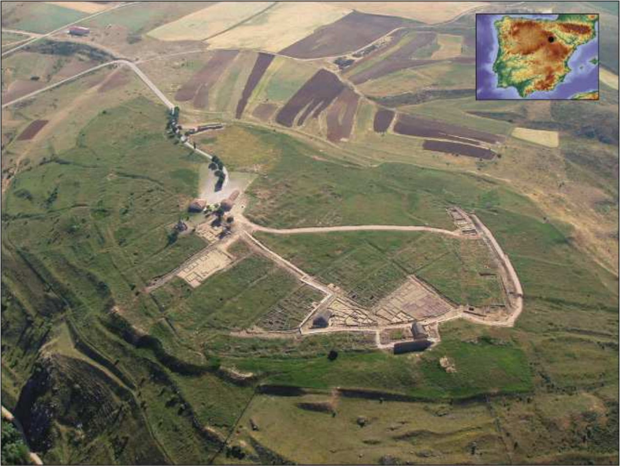
Vista aérea de Numancia.