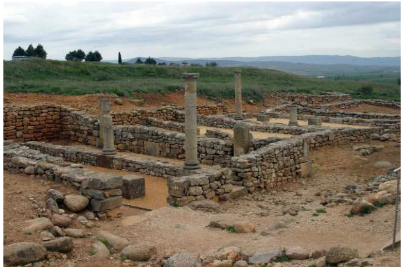
Izq.: Monumentos a los héroes numantinos (de 1842 y 1905). Dcha.: Casas con patios porticados en el barrio sur, lo más visible durante mucho tiempo en Numancia.