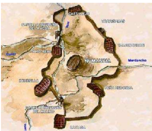
Numancia y el cerco romano de Escipión (134-133 a. C.).

No obstante, éramos conscientes de que había que dar un salto cualitativo en Numancia para que el yacimiento fuera mejor entendido. A tal fin se reconstruyeron sobre su base original una casa de la ciudad celtibérica y otra de la romana, que muestra-