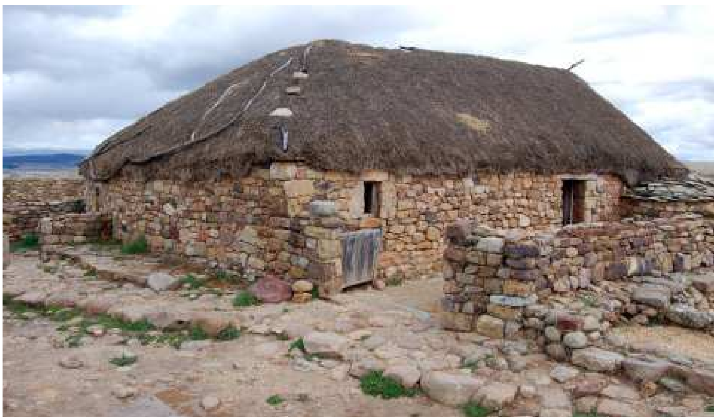
Arriba: Casas celtibéricas que comparten medianería. Abajo: Casa romana.